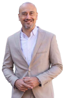
JAVIER LÓPEZ ESTRADA ALCALDE DE TORRELAVEGA

Un año más, la llegada del mes de agosto marca el inicio de uno de los momentos más esperados por todos los torrelaveguenses, las Fiestas de la Virgen Grande. Días en los que nuestra ciudad se transforma, se llena de color, de música, de tradición y de alegría compartida. Son fechas especiales para vivir la ciudad intensamente, para abrir nuestras calles a vecinos, vecinas y visitantes, y para reforzar el sentimiento de orgullo que todos sentimos por pertenecer a Torrelavega.