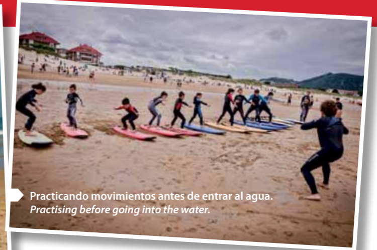
Practicando movimientos antes de entrar al agua. Practising before going into the water.