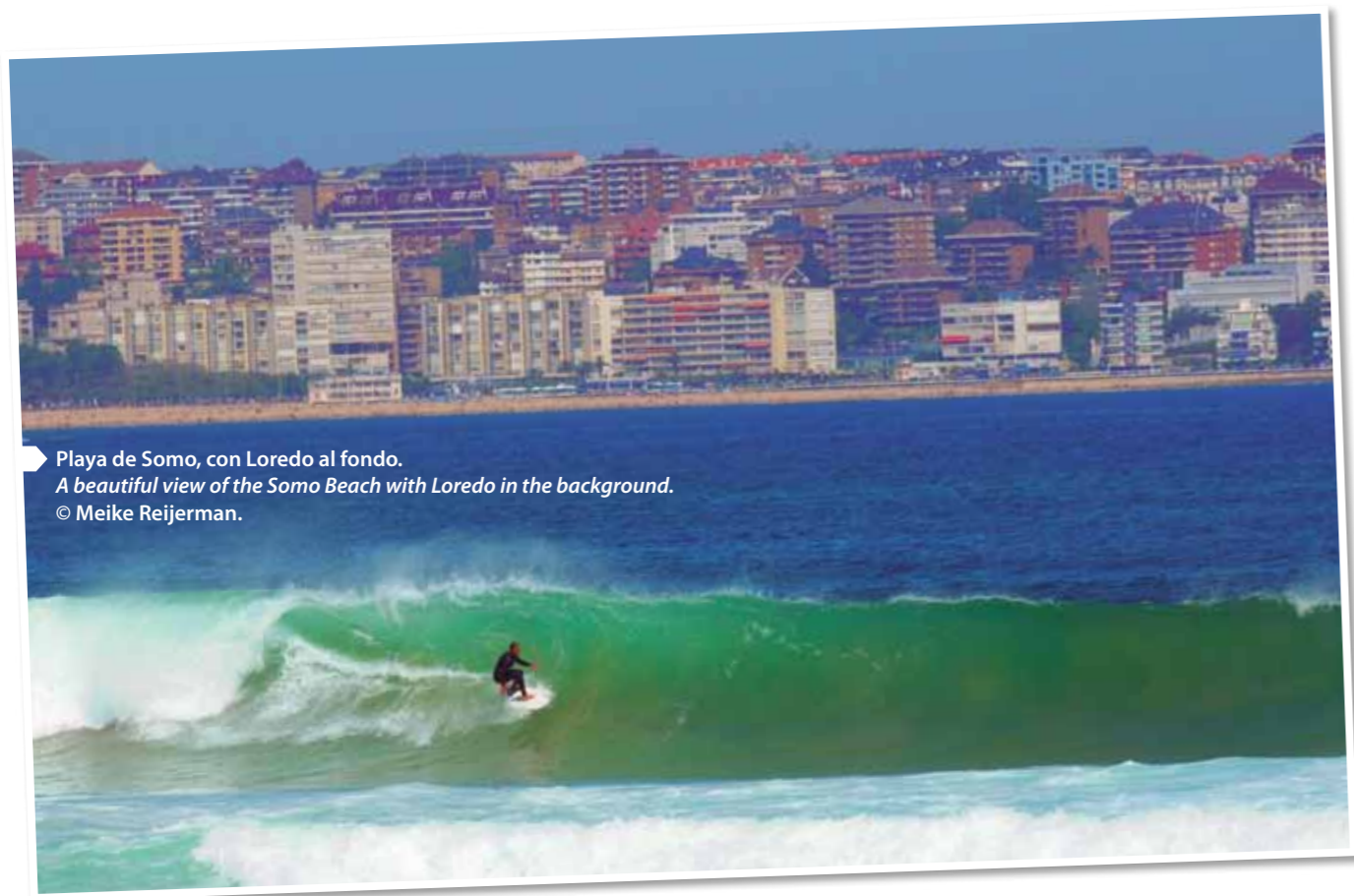
Playa de Somo, con Laredo al fondo. A beautiful view of the Somo Beach with Laredo in the background.

No en vano, Cantabria es la cuna del surf en España y pionera nacional. A principios de los años 60, los cántabros ya se deslizaba por las olas de El Sardinero con sus plankis y en 1963 Jesús Fiochi trajo desde Francia la primera tabla de la que se tiene constancia en España. El santanderino se convertía así en el primer surfer en cabalgar una ola con su Barland llegada de Biarritz.