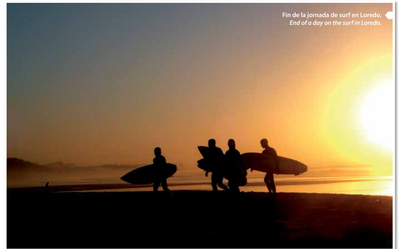
Fin de la jornada de surf en Laredo. End of a day on the surf in Laredo.

Somo (Ribamontán al Mar): Situated to the east of the Bay of Santander, the Somo Beach is very popular with surfers and is home of a number of surfing schools which offer lessons for beginners. It is also home of a variety of establishments specialising in surfing equipment.