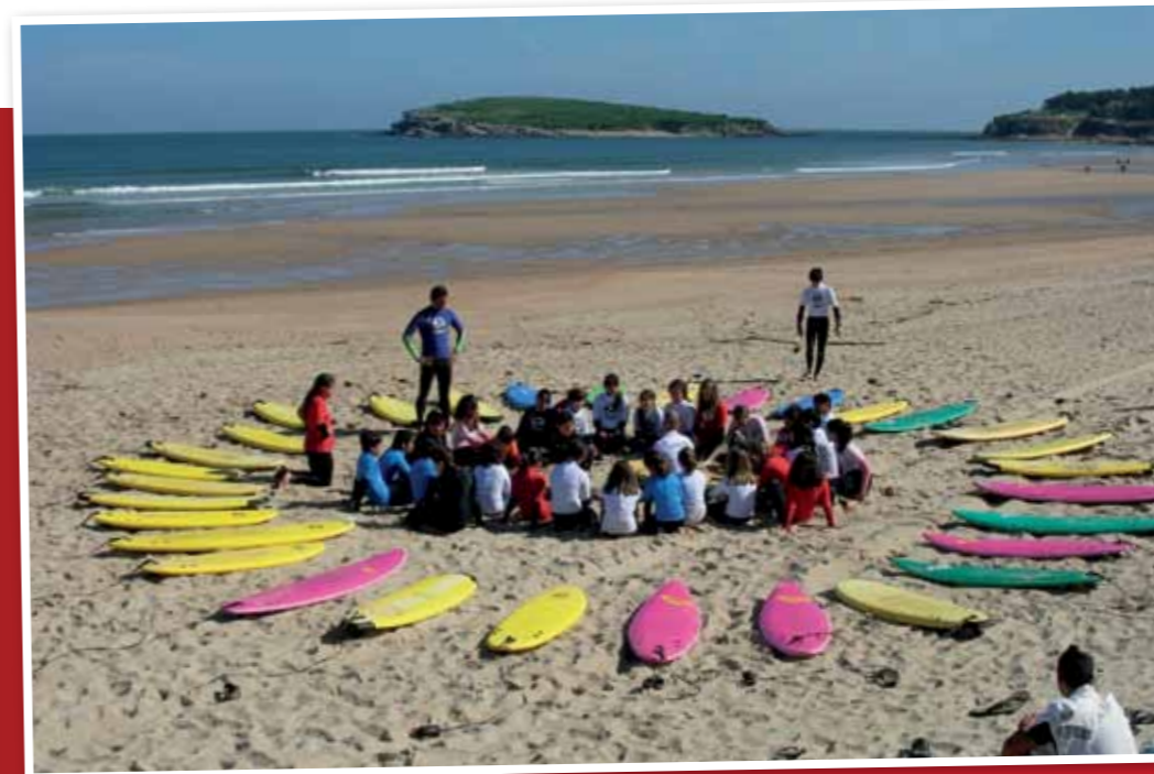
Todos en círculo escuchando al monitor. A circle of young surfers paying attention to the surfing monitor.

www.surfatodacosta.es • www.specialsurf.com www.federacioncantabradesurf.com • www.turismodecantabria.com