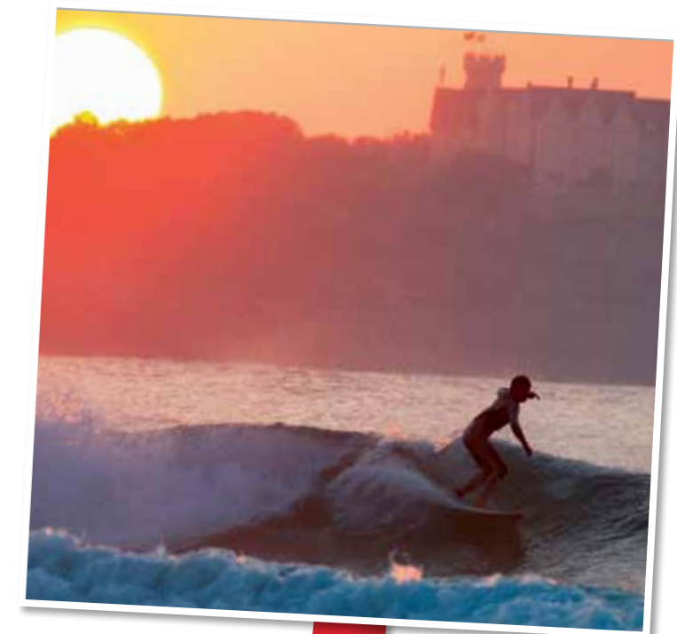
Un aficionado con el Palacio de la Magdalena al fondo. A surfing enthusiast with the Magdalena Palace in the background.

Canallave y Valdearenas (Lienres): En pleno Parque Natural de las Dunas de Lienres se encuentra Canallave o Cobachos. Ésta, junto con la de Valdearenas, son dos de las playas consideradas más constantes de todo el litoral e ideales para practicar surf en cualquier época del año. Valdearenas destaca por la singularidad de su paisaje que se encuentra al abrigo de un bosque que guarda celosamente los casi tres kilómetros de arenal.