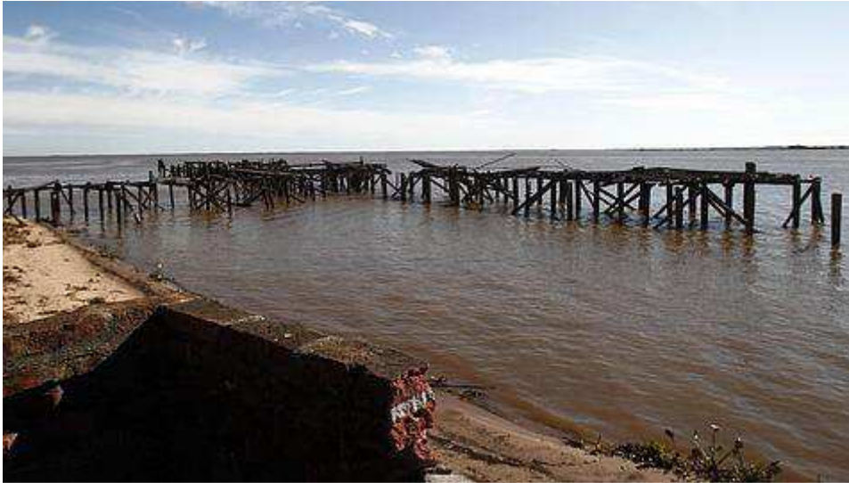
Fotografía del muelle del Frigorífico Anglo, en Fray Bentos, departamento de Río Negro (Uruguay)

26. Paisaje cultural industrial de Fray Bentos (Uruguay).