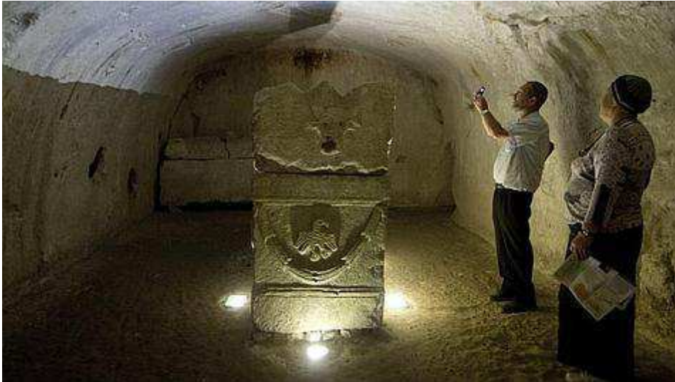
Visitantes realizan fotografías en la necrópolis de Bet She'arim, cerca de Kiryat Tiv'on, en Israel