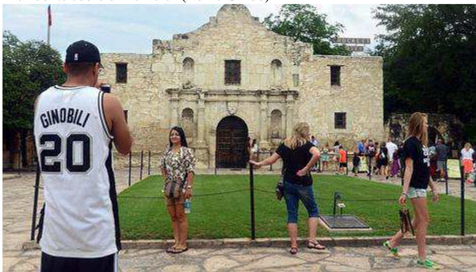
El Álamo, en San Antonio, Texas