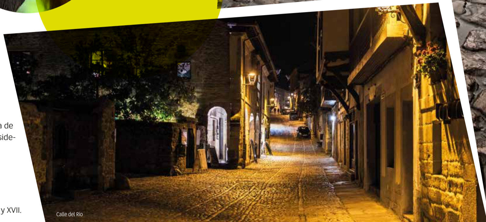
Calle del Río