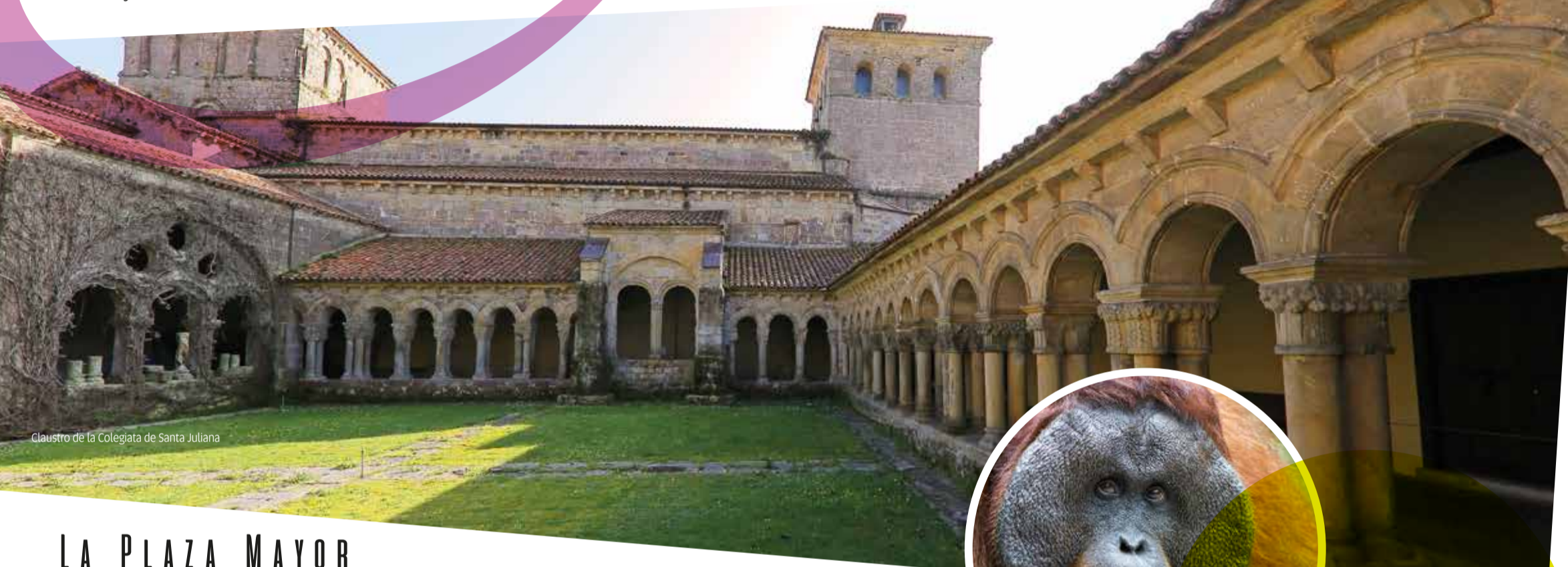
Claustro de la Colegiata de Santa Juliana

En el interior, se puede observar la pila bautismal románica, la estatua yacente de Santa Juliana, de estilo gótico tardío, y el retablo mayor , que es renacentista, de principios del siglo XVI. En cuanto al claustro , es un magnífico ejemplo de arte románico con muchos elementos comunes a otras iglesias del Camino Francés. Santa Juliana siempre ha sido un hito importante de la ruta jacobea y fue visitada por San Francisco de Asís entre los años 1213 y 1214.